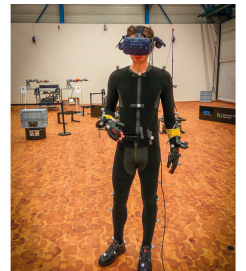
3-D Renderings Dawid Knozowski, Fotos FLW

Der Lehrstuhl für Förder- und Lagerwesen FLW sucht ab sofort eine studentische Hilfskraft für die Mitarbeit in aktuellen Forschungsprojekten wie bspw. dem Innovationslabor Hybride Dienstleistungen in der Logistik. Dieses Projekt ist interdisziplinär ausgelegt und wird von Forschern der TU Dortmund in Kooperation mit dem Fraunhofer IML durchgeführt. Schwerpunkt der Forschung ist die Mensch-Technik-Interaktion in der Logistik. Dazu werden ein Motion-Capturing-System, Funkmesstechnik, Drohnenschwärme, fahrerlose Transportsysteme, intelligente Behälter, eine Laserprojektionsanlage und viele weitere Innovations-technologien eingesetzt.